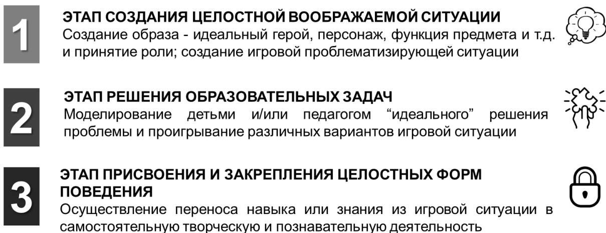
Рис. 1 Алгоритм разработки и совершенствования игровых технологий